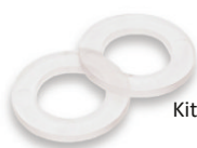
Kit di guarnizione piana

Conforme alla norma UNI EN 12915-1:2009 : Prodotti utilizzati per il trattamento delle acque destinate al consumo umano