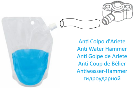
Anti Colpo d'Ariete Anti Water Hammer Anti Golpe de Ariete Anti Coup de Bélier Antiwasser-Hammer гидроударной