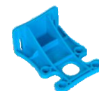
Wall Support 1